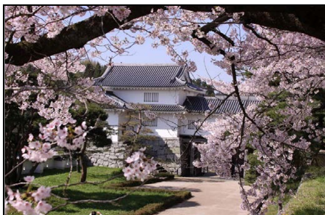
霞ヶ城公園 箕輪門