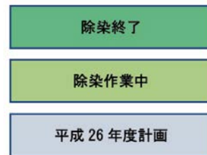
住宅除染進捗図(平成26年12月末時点)