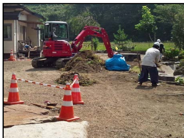
住宅敷地内の除染作業