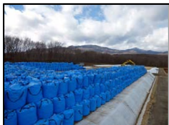
仮置場造成の様子