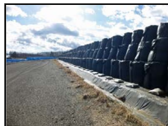
仮置場での保管の様子