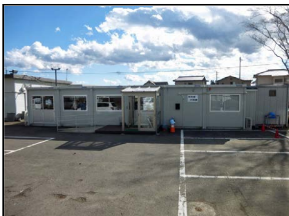
西郷村放射能対策課事務室