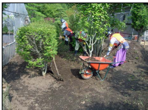
汚染土壌剥ぎ取り作業