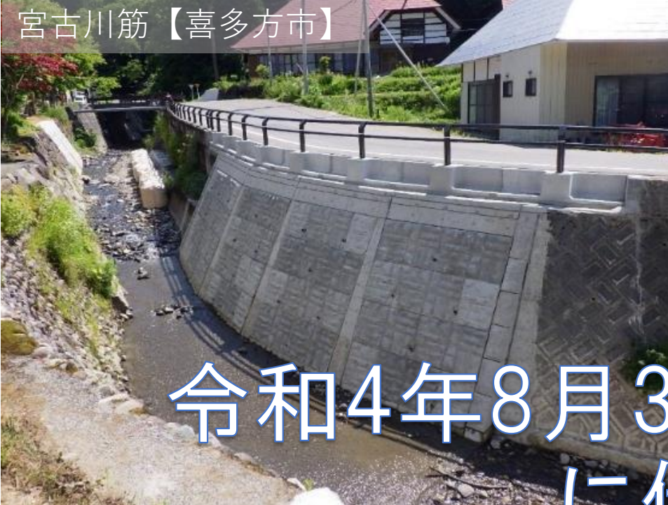
熱塩加納山都西会津線【喜多方市】